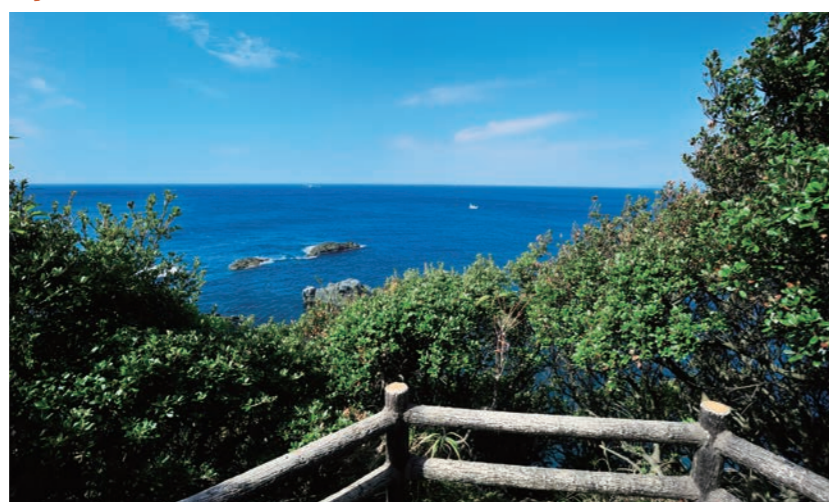
潮岬の西側に位置。春先に四国沖から紀伊半島を東に進む鯨を見張っていたという

●しおのみさきのくじらやまみ ④東牟婁郡串本町潮岬 ⑤バス停潮岬灯台前から徒歩約7分【MAP】P22A4