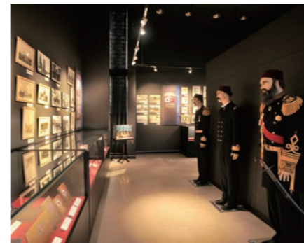
乗員の遺品などを展示。事故では580余名が犠牲となり、島民は生存者救出に尽力した

●とるこきねんかん ☎0735-65-0628 ④東牟婁郡串本町樫野1025-26 ⑤バス停樫野灯台口から徒歩約3分 ⑥9時～17時 ⑦無休 ⑧大人500円、小・中・高校生250円【MAP】P22B4