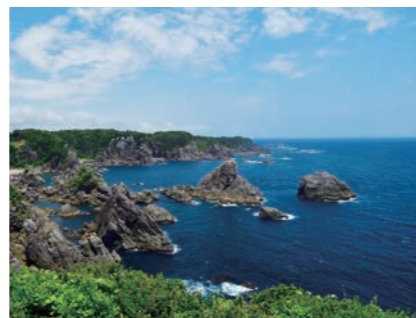
紺碧の海と奇岩が織り成す絶景は「21世紀に残したい日本の自然100選」に選ばれている

●うみこんごう ④東牟婁郡串本町樫野 ⑤くしもと観光周遊バス「まぐトル号」バス停海金剛からすぐ【MAP】P22B4