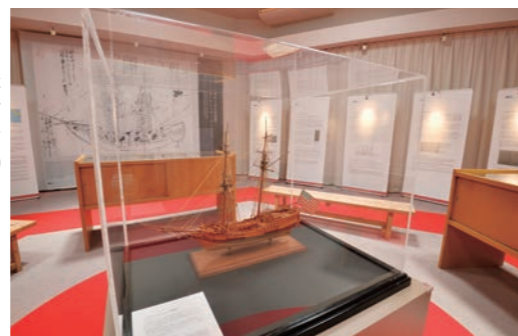
日本とアメリカの初めての接触について詳しく知ることができる

●にちべいしゅうこうきねんかん ☎0735-65-0099 ④東牟婁郡串本町樫野1033 ⑤くしもと観光周遊バス「まぐトル号」バス停海金剛からすぐ ⑥9時～17時 ⑦無休 ⑧大人250円、小・中・高校生120円 【MAP】P22B4