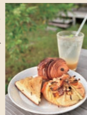
野菜ののったフォカッチャ440円など。ドリンクはジンジャーソーダ540円

●なぎ・きつさゆの 国産小麦や自家製発酵種で丁寧に作られるパンを求め、遠方からもファンが訪れる。本格ハード系から菓子パン、地元の野菜や果物を使ったものなど幅広くあり、ピザも評判。カフェのドリンクも充実している。 ☎0735-65-0065 ④東牟婁郡串本町大島1158 ⑤JR串本駅から車で約10分 ⑥9時30分～18時(喫茶は10時～16時30分LO) ⑦月・火曜(祝日の場合は営業)【MAP】P22A4